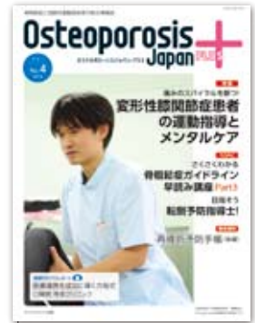
第1巻第4号 2016年12月 変形性膝関節症患者の 運動指導とメンタルケア 資料:再骨折予防手帳(後編)