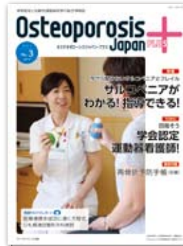
第1巻第3号 2016年9月 サルコペニアがわかる! 指導できる! 資料:再骨折予防手帳(前編)