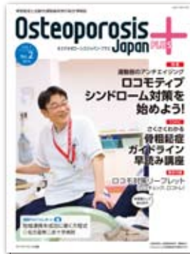
第1巻第2号 2016年5月 ロコモティブシンドローム 対策をはじめよう! 付録:ロコモ対策指導箋