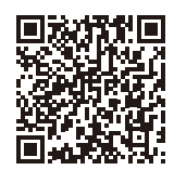
HAP研修申込管理システム